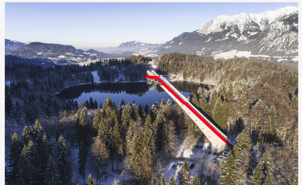
Besichtigungen der Heini-Klopper-Schanze in Oberstdorf sind von April bis Oktober täglich von 09.30 bis 17.30 Uhr und von November bis März täglich ab 09.30 bis 16.30 Uhr möglich. Weitere Informationen finden Sie unter: www.skiflugschanze-oberstdorf.de