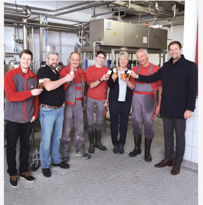
Der Hirschbräu mit Bürgermeister Christian Wilhelm