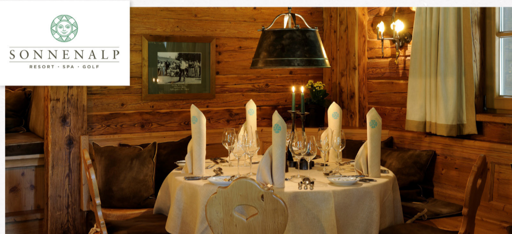
Restaurant Waldhaus am Golfplatz Sonnenalp | Muderbolz 10 | 87527 Ofterschwang Tel.: 08321 / 272 180 | E-Mail: waldhaus@sonnenalp.de täglich geöffnet von 12.00 - 20.30 Uhr | Küche von 12.00 - 20.00 Uhr

Durch gemütliche Eleganz in alpenländischem Stil zeichnet sich das Restaurant Waldhaus am Golfplatz Sonnenalp aus. Mit viel Liebe zum Detail genießen Gäste in heimeliger Atmosphäre klassisches Käsefondue, feine Kalbsleber Berliner Art oder Herzhaftes aus der regionalen Allgäuer Küche. Auf der idyllischen Sonnenterrasse öffnet sich der Blick auf makellosoes Grün und das fantastische Panorama der Allgäuer Alpen. Hochzeit, Weihnachtsfeier, Taufe, Geburtstag oder die erfrischende Einkehr nach der Golfrunde - im Waldhaus finden Sie für jeden Anlass die ideale Räumlichkeit.