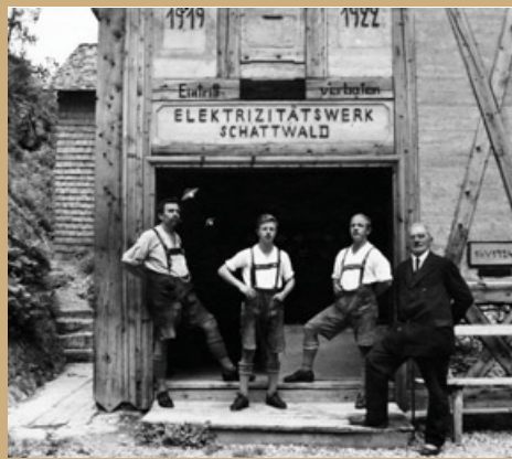
Bilder von den Anfängen ...